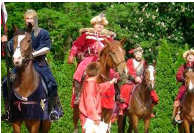
To do boju!!