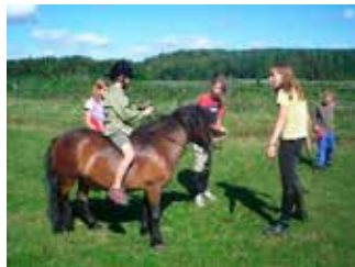
Kucyk „Tuptuś” w pracy