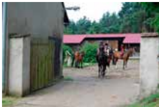
Dla odważnych przejażdżki w siodle