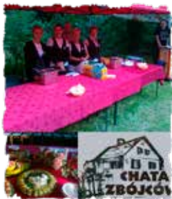
Jedzonko też jest pyszne