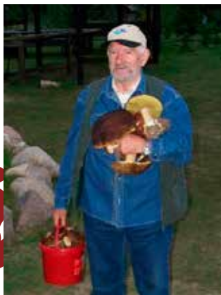
Grzybiarze mają swój raj