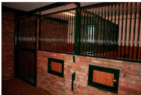
A tutaj odpocznie Twój czworonogi przyjaciel