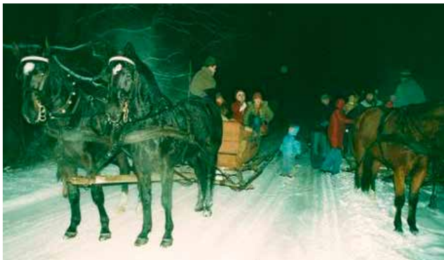
A zimą oczywiście kulig