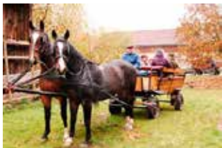
A może by tak bryczką?...