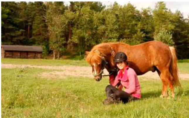
Mój wierny przyjaciel