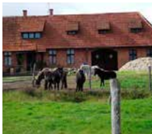
Milusińscy przyjaciele dzieci